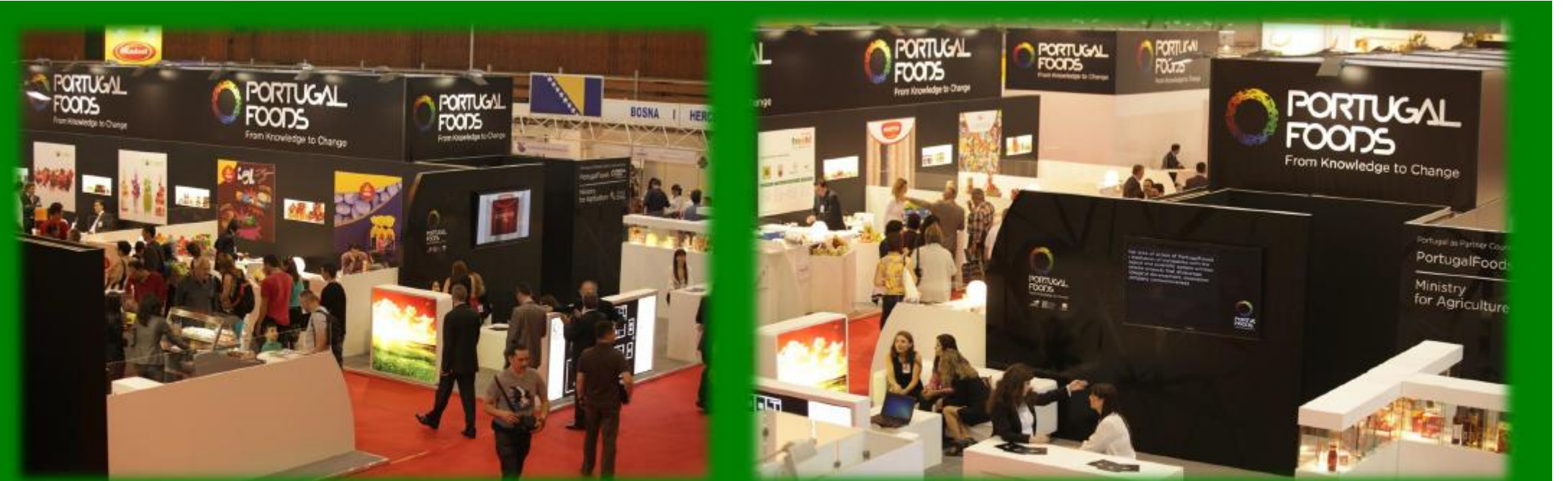
Feira Internacional de Agricultura de Novi Sad | Sérvia - Maio 2011

A presença de 51 empresas materializaram a maior presença conjunta de sempre da Fileira Agro-Alimentar Nacional numa Feira Internacional