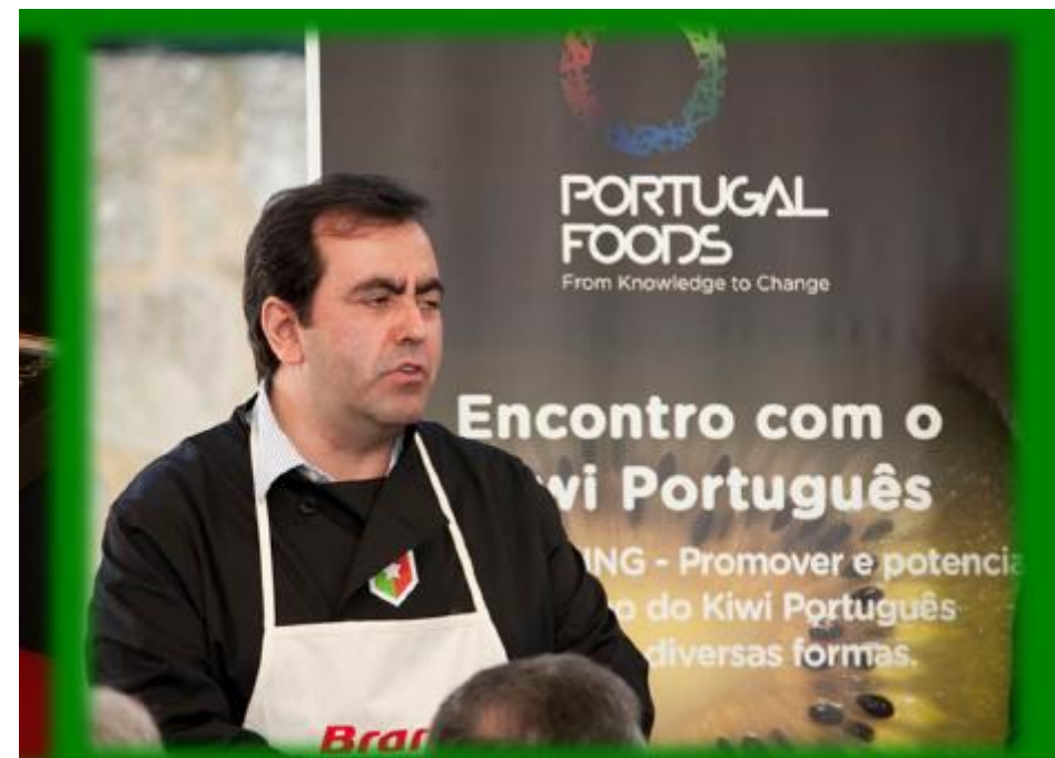
Encontro com o Kiwi Português 2010