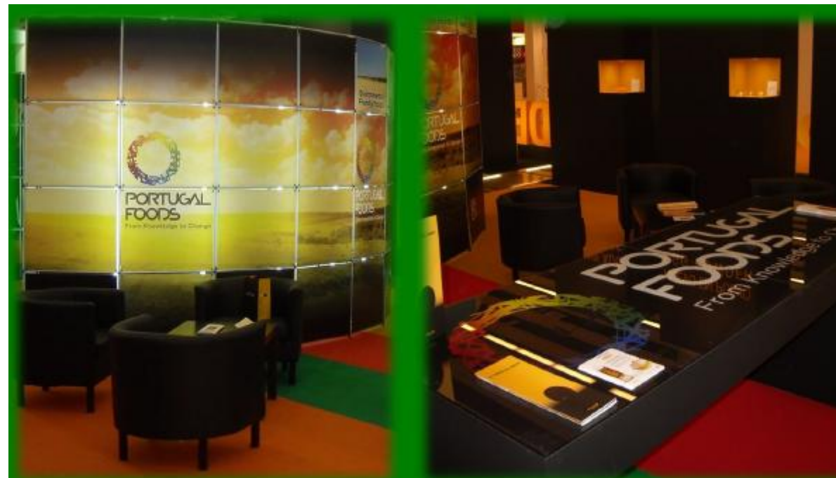
Feira Alimentaria, Barcelona 2010